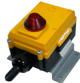
6KC, 6PC, 6KVC